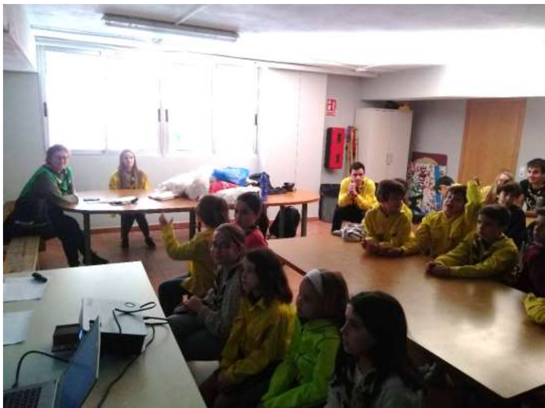
Ilustración 4 Actividad con Agua de Coco - Manada