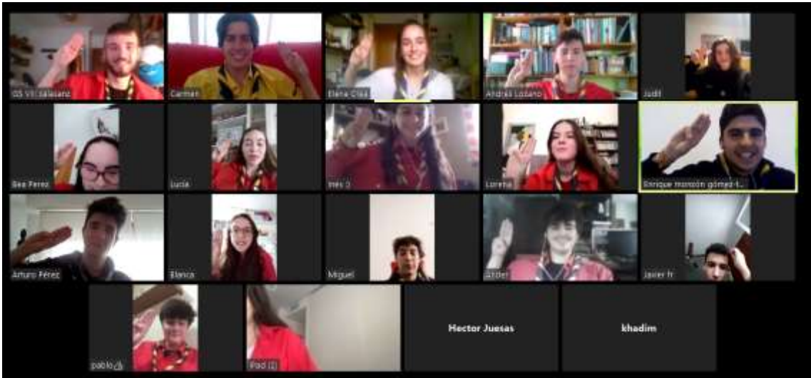
Ilustración 8 Cinefórum online Posta "La huella ecológica del hombre 2007"