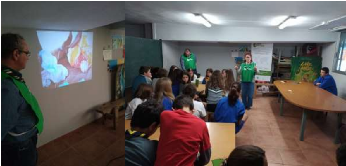
Ilustración 6 Actividad con Agua de Coco - Tropa