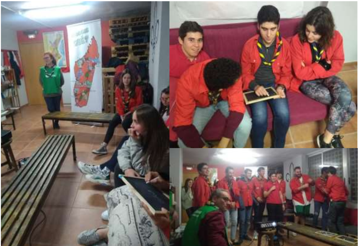
Ilustración 5 Actividad con Agua de Coco - Posta