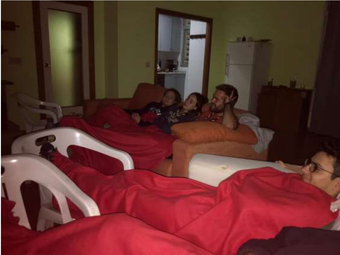
Ilustración 7 Cinefórum Clan "Capitán fantástico"