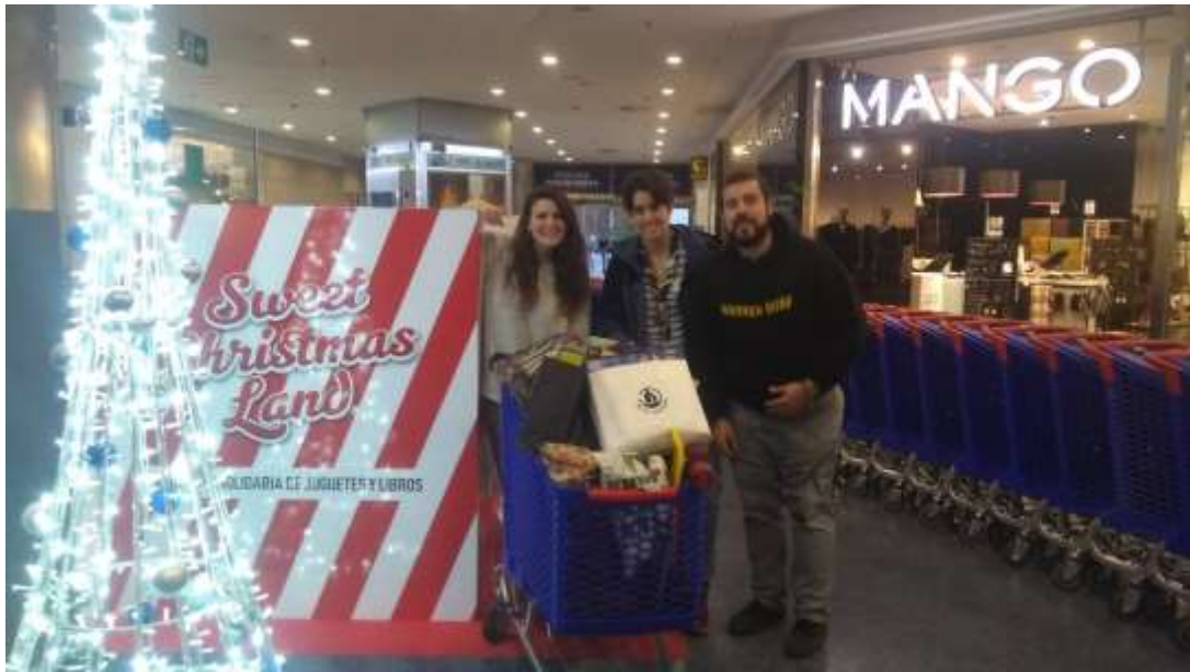
Ilustración 3 Recogida de juguetes